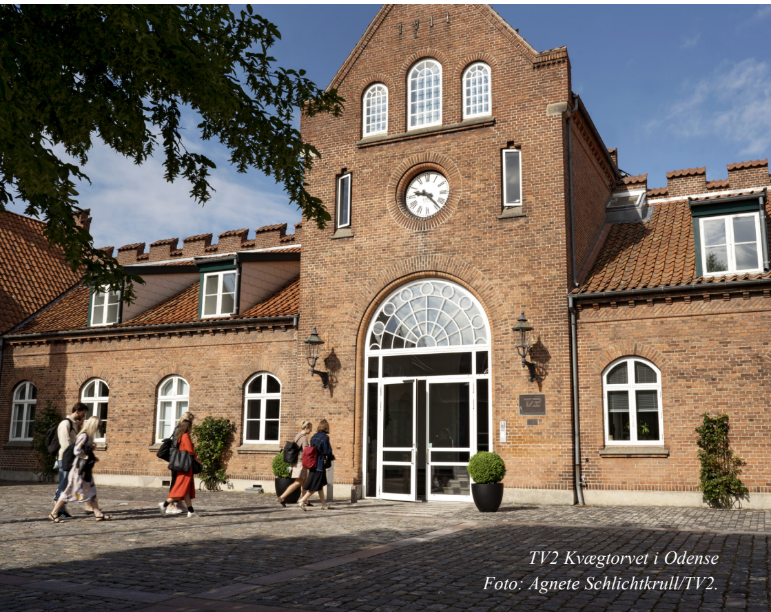
TV2 Kvægtorvet i Odense

Kontaktoplysning Leder Forbrugerstof Set fra sidelinien Lokalafdelingerne