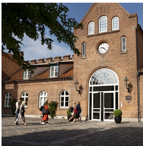
TV2 Kvægtorvet i Odense.