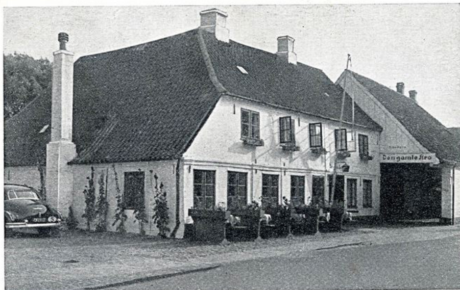
Den gamle kro